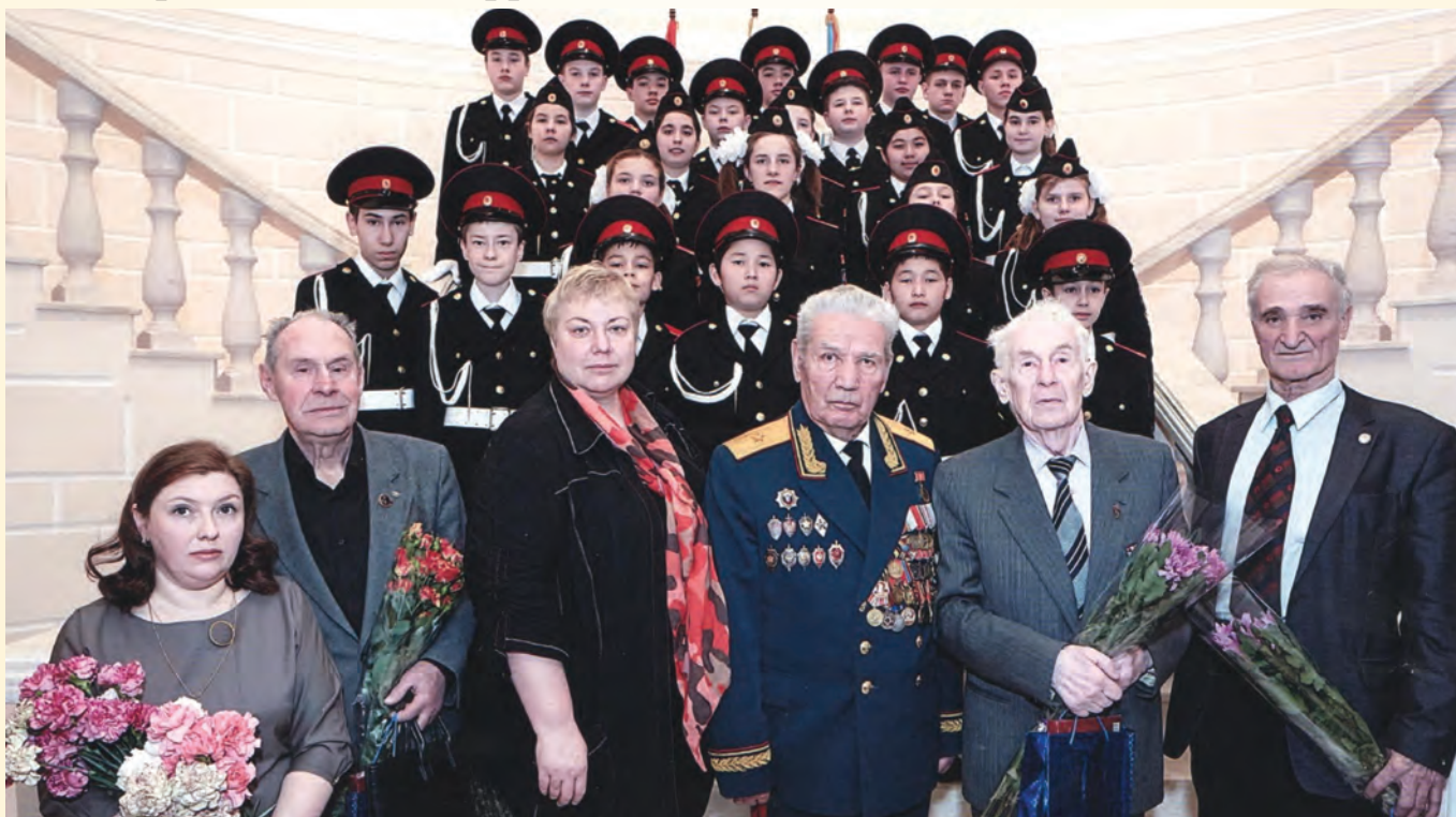
Присутствовавшие на торжестве кадеты, ветераны, администрация школы и родители детей.

Весь процесс посвящения в кадеты и принятия клятвы на верность служения Отечеству был снят телекомпанией «Звезда» и в тот же день показан в вечернем выпуске новостей. Было объявлено, что шефство над кадетским классом берет военная контрразведка.