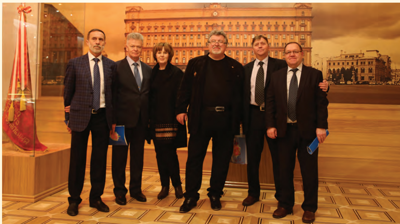
Ветераны в Зале боевой славы военной контрразведки ФСБ России.