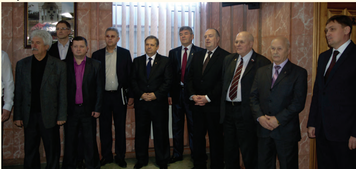
Ветераны на открытии Центра