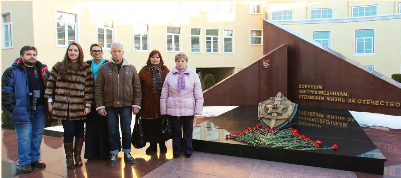
У Монумента Славы «Военным контрразведчикам, отдавшим жизнь за Отечество»

30 августа 2016 года состоялся митинг, посвященный открытию мемориальной доски Артузову Артуру Христиановичу. Мемориальная доска установлена в г. Москве в доме № 9 в Милютинском переулке, где проживал А.Х.Артузов. Выступившие в митинге ветераны военной контрразведки и службы внешней разведки отметили его большую роль в содании и становлении отечественных органов безопасности.