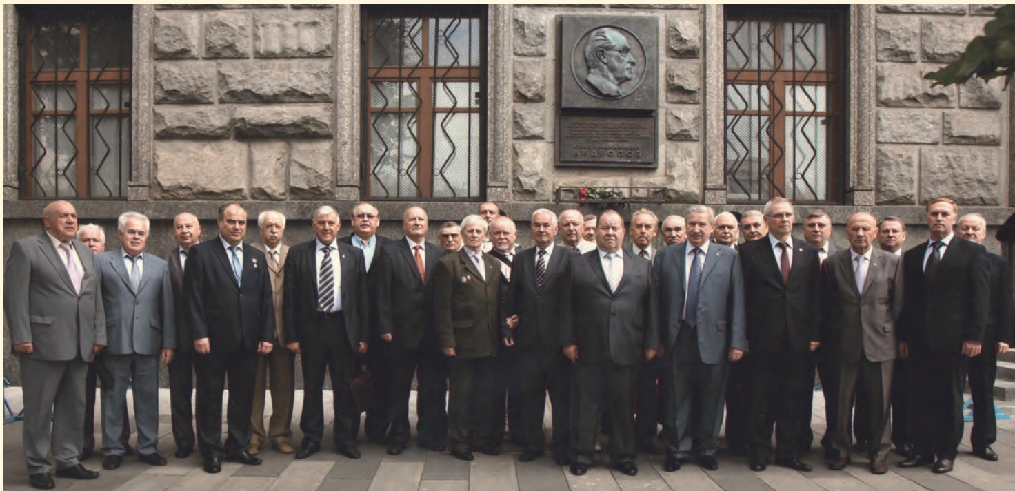
Ветераны у мемориальной доски