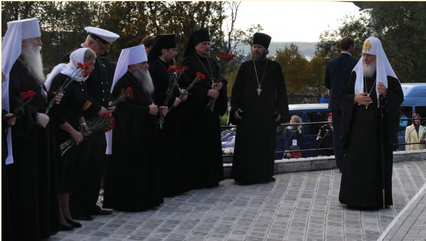
Патриарх в г. Североморске

Совет ветеранов все мероприятия по патриотическому воспитанию, пропаганде и увековечению подвигов военных контрразведчиков, материальной поддержке ветеранов и членов их семей, духовному воспитанию и другим вопросам решает совместно с межрегиональной общественной организацией «Ветераны военной контрразведки» при поддержке и направляющей роли Департамента военной контрразведки ФСБ России.