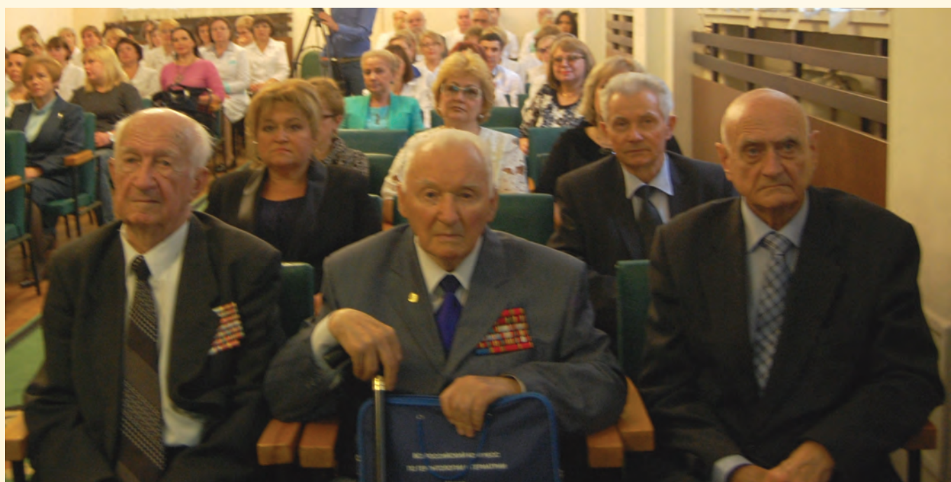
Участники торжественного мероприятия