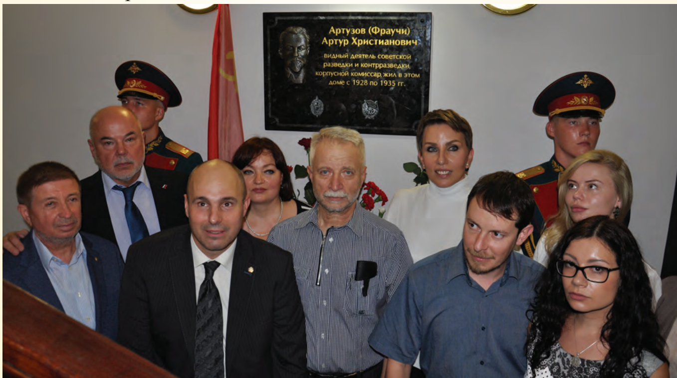
Родственники А.Х. Артузова у мемориальной доски, открытой в его честь в доме № 9 по Милютинскому переулку в г. Москве

30 августа 2016 года состоялся митинг, посвященный открытию мемориальной доски Артузову Артуру Христиановичу. Мемориальная доска установлена в г. Москве в доме № 9 в Милютинском переулке, где проживал А.Х.Артузов. Выступившие в митинге ветераны военной контрразведки и службы внешней разведки отметили его большую роль в содании и становлении отечественных органов безопасности.