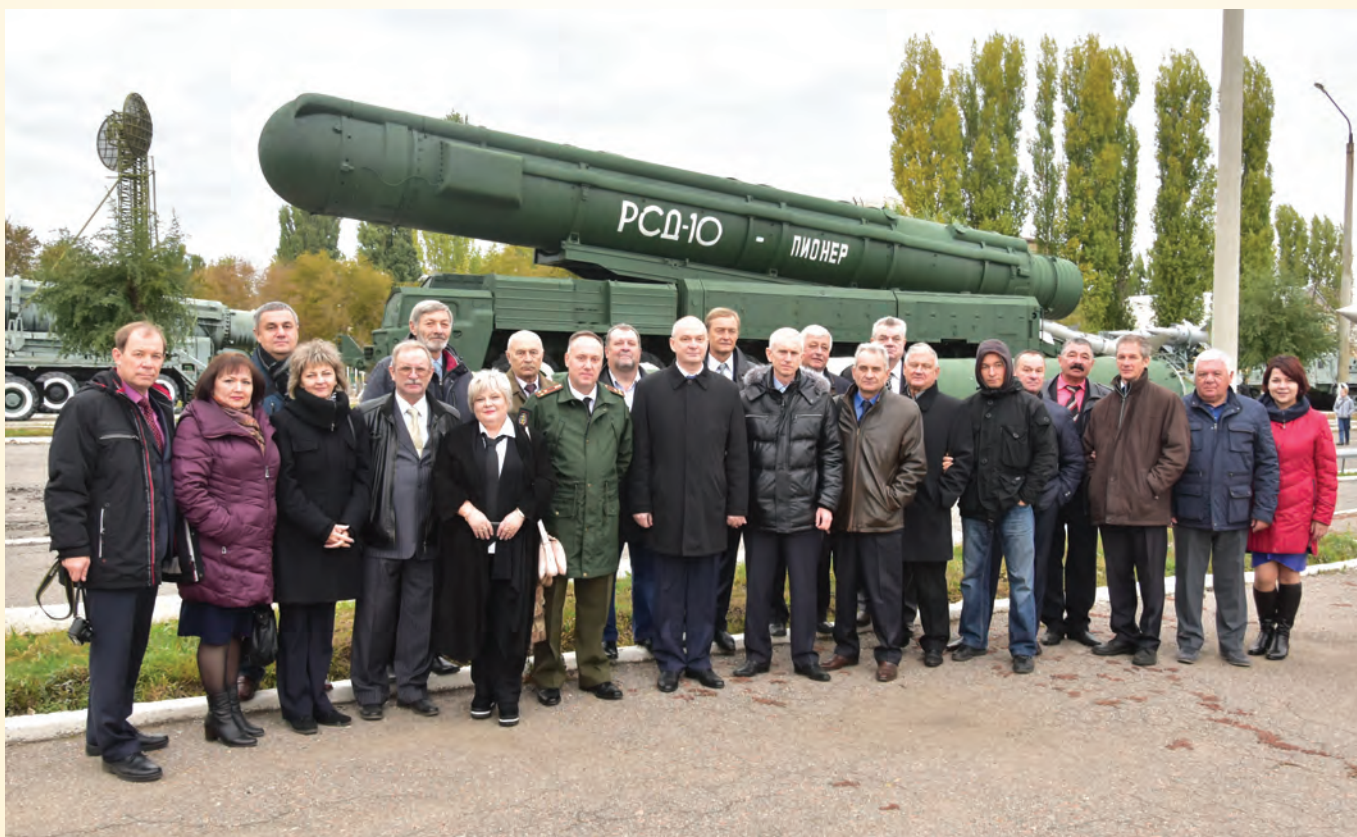
У первого подвижного ракетного комплекса «Пионер» (полигон «Капустин Яр»)