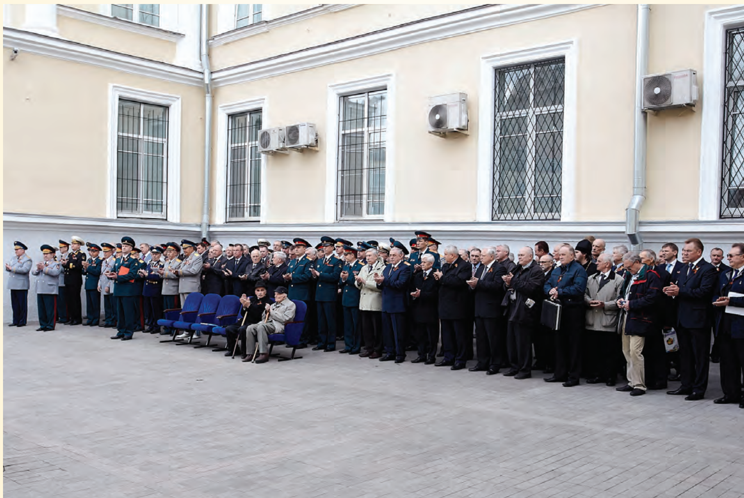
Участники торжественной церемонии

5 мая 2016 года в честь 71 –ой годовщины Победы советского народа в Великой Отечественной войне у Монумента Славы «Военным контрразведчикам, отдавшим жизнь за Отечество» по инициативе Департамента и Совета ветеранов состоялась торжественная церемония празднования Дня Великой Победы. В ней приняли участие ветераны военной контрразведки, руководители Департамента, начальники органов безопасности в войсках Московского региона, руководители подразделений Департамента, курсанты Голицынского пограничного института ФСБ России, кадеты подшефной школы № 1231 г. Москвы.