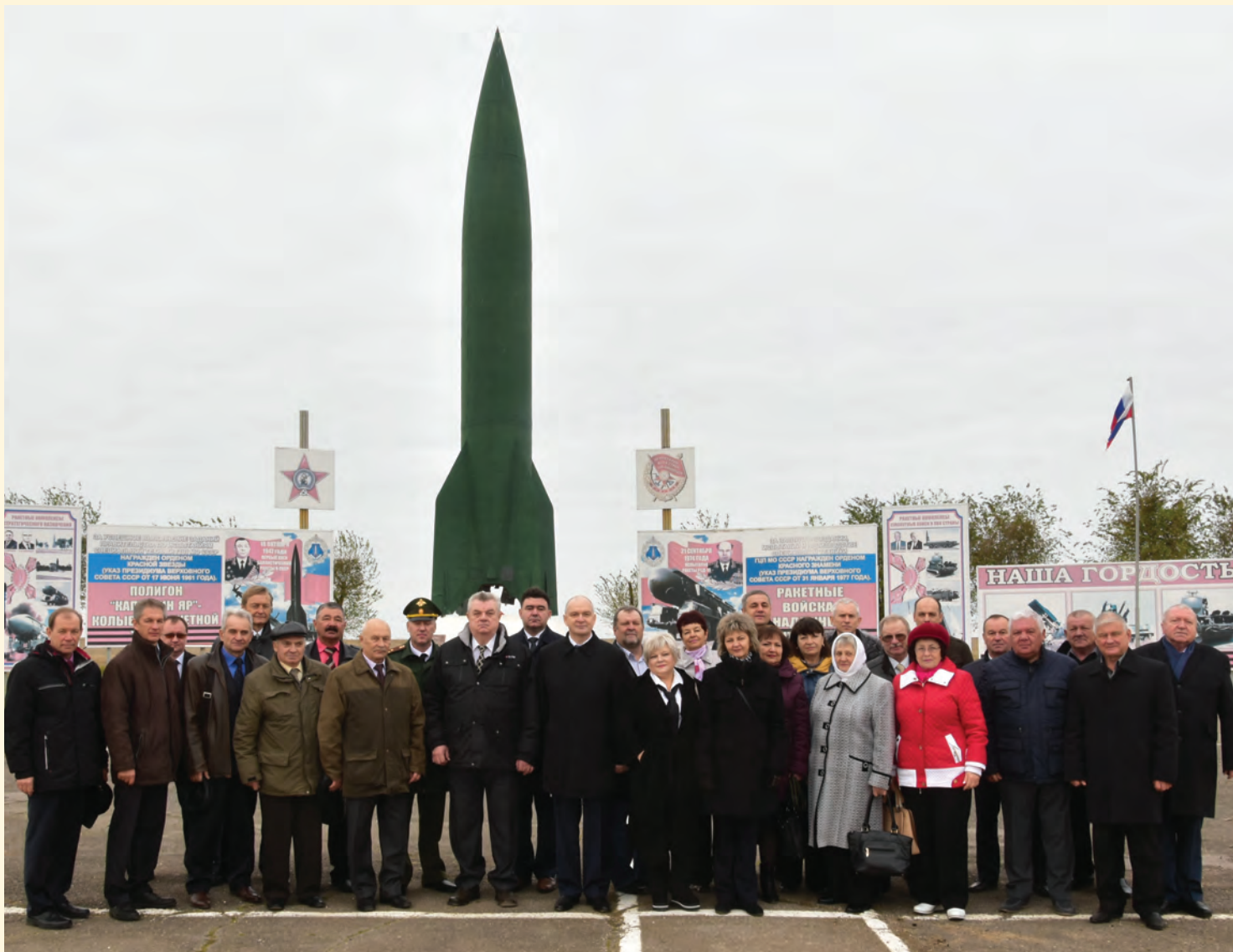
Ветераны на месте старта первой советской баллистической ракеты (полигон «Капустин Яр»)

По договоренности с Департаментом, дирекцией школы № 1231 имени Поленова г. Москвы и родительским комитетом в 2015 году был создан специальный кадетский класс.