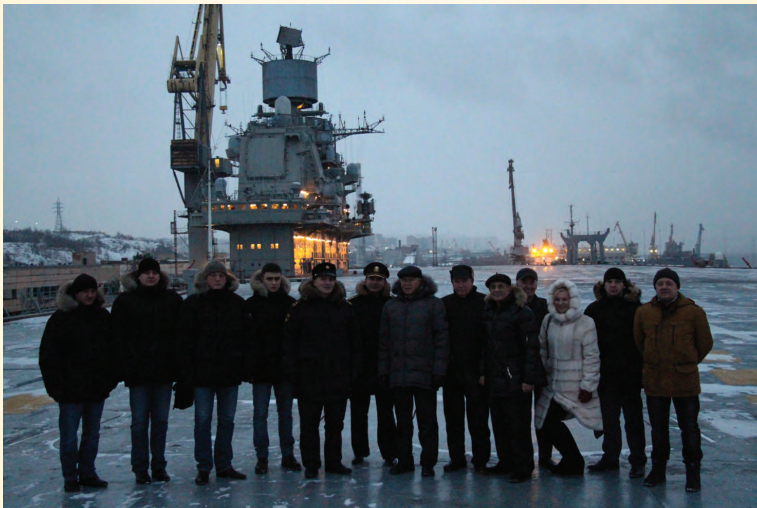
Ветераны на палубе «Адмирала Кузнецова»

Представители Совета ветеранов военной контрразведки посетили тяжелый авианесущий крейсер «Адмирал Кузнецов», где ознакомились с его вооружением, выучкой и слаженностью действий экипажа корабля.