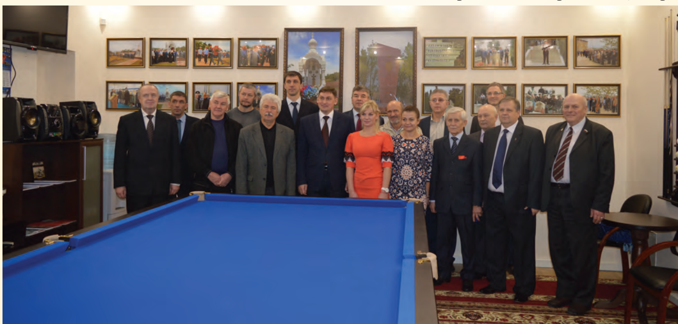
В бильярдной Центра