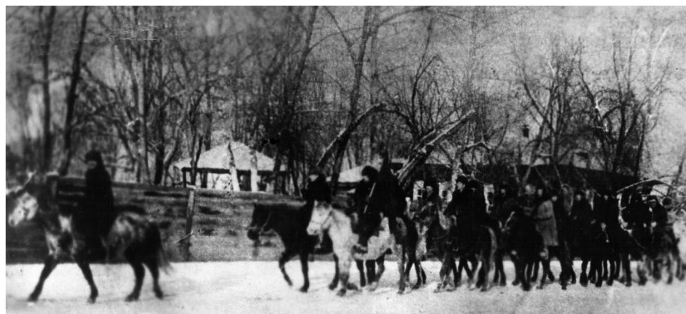
ВСТУПЛЕНИЕ ПАРТИЗАН В СЕЛО СОЛОНЕШНОЕ.

После победы Советской власти на Алтае в марте 1918г. создать чрезвычайную комиссию на Алтае не успели, так как в марте этого года началась Гражданская война, в июне губерния оказалась в руках белочехов, и Советская власть была свергнута, а уже в декабре этого же года к власти в Сибири пришёл адмирал Колчак. Начался белый террор.