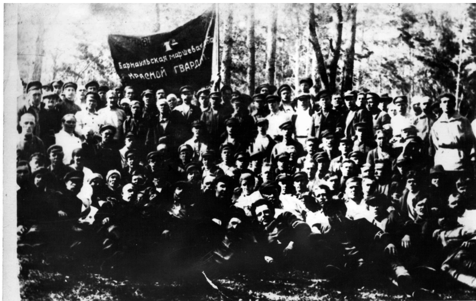
ПЕРВАЯ БАРНАУЛЬСКАЯ МАРШЕВАЯ РОТА КРАСНОЙ ГВАРДИИ. УЧАСТВОВАЛА В БОЯХ НА ЗАБАЙКАЛЬСКОМ ФРОНТЕ ПРОТИВ АТАМАНА СЕМЕНОВА.