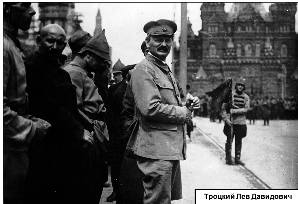
Троцкий Лев Давидович

Приток добровольцев в РККА начал иссякать. Видя это, ВЦИК специальным декретом ввёл в стране всеобщее военное обучение трудящихся (всевоуч). Каждый трудящийся в возрасте от 18 до 40 лет без отрыва от основной работы должен был за 96 часов пройти курс военного обучения, стать на учёт как военнообязанный и по первому призыву советского правительства вступить в ряды Красной армии.